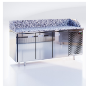
CШС-0,3 GN-1850 NRGBS

Архангельск (8182)63-90-72 Астана (7172)727-132 Астрахань (8512)99-46-04 Барнаул (3852)73-04-60 Белгород (4722)40-23-64 Брянск (4832)59-03-52 Владивосток (423)249-28-31 Волгоград (844)278-03-48 Вологда (8172)26-41-59 Воронеж (473)204-51-73 Екатеринбург (343)384-55-89 Иваново (4932)77-34-06