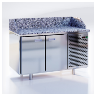
CШС-0,2 GN-1400 NRGBS