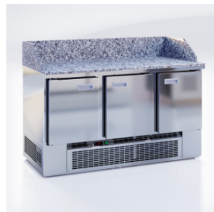
CШС-0,3 GN-1500 NDGBS